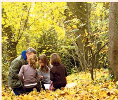
La diversité des arbres