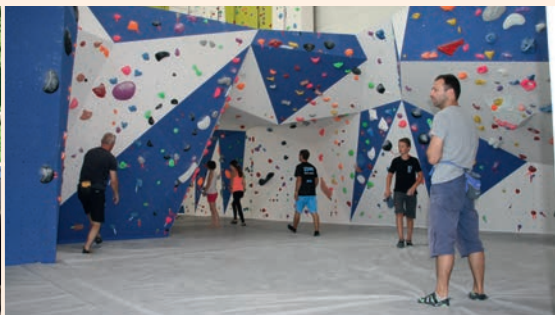
L'escalade et les JO