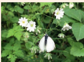
Détermination des fleurs