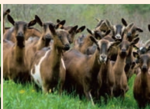
Paysan en Lyonnais aujourd'hui