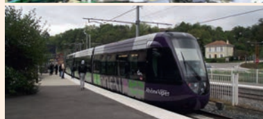
L'atelier de maintenance du tram-train