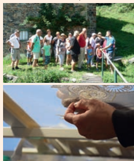
La broderie d'art