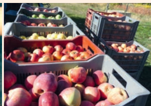
La Pomme, plaisir d'automne