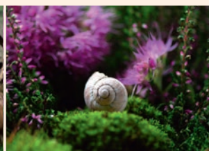
Enquête policière : Hugo l'escargot