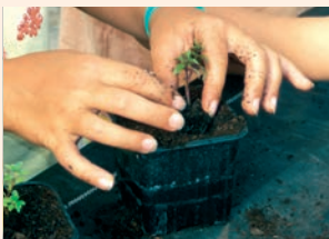
Découverte sensorielle du jardin