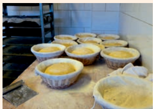
Les mains à la pâte

RÉSERVATION OBLIGATOIRE (nombre de places limité) AU GUICHET OU PAR TÉLÉPHONE.